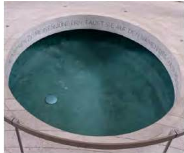
St. Peter und Paul, Eisleben, Foto: Peter Kane

Am Freitag, 10. Januar 2025, sind um 19.00 Uhr wieder alle recht herzlich zur Trauerandacht in die Basilika eingeladen. Wir gedenken namentlich und mit einer kleinen Kerze aller, die seit der letzten Andacht im Dezember verstorben sind. Gerne werden auch die Namen von Verstorbenen verlesen, die nicht in Waldsassen gewohnt haben, oder deren Geburts- oder Sterbetag sich jährt. Anmeldung dafür unter Tel.: 09633/91223 oder im Pfarrbüro Tel.: 1387 oder auch per Mail: info@gertrud-hankl.de. Eingeladen sind alle, die um einen lieben Menschen trauern, erst kurz oder auch schon länger, oder anderweitig Schmerz und Leid erfahren haben. Gönnen Sie sich eine Auszeit vom Alltag, in der Heilung geschehen kann.